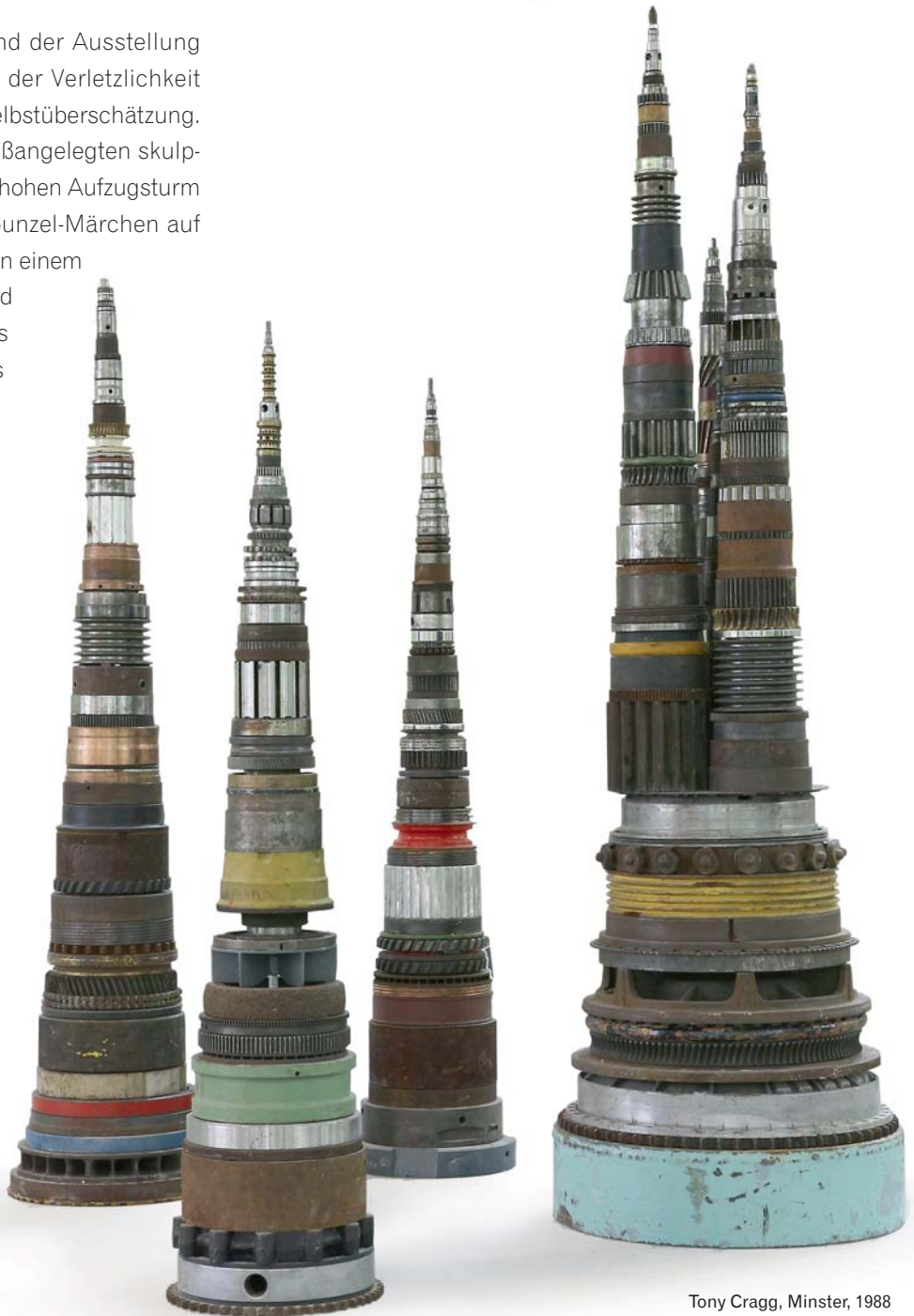
Sonja Alhäuser Das Willkommen, 2010 © VG Bild-Kunst, Bonn 2014

Die Ausstellung ist eine Kooperation mit den Städtischen Museen Heilbronn.