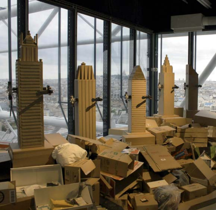
Malachi Farrell, Nothing stops a New Yorker, 2005 Ausstellungsansicht Centre Pompidou, 2010 © VG Bild-Kunst, Bonn 2014 Foto: Malachi Farrell