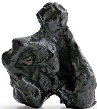
Hans Arp Turmmensch Trier, 1961 Arp Museum Bahnhof Rolandseck © VG Bild-Kunst, Bonn 2014 Foto: Mick Vincenz

Ausgangspunkte der Ausstellung bilden die gerade einmal 11 cm hohe Bronzeskulptur »Turmmensch Trier« von Hans Arp aus dem Jahre 1961, die aus dem 15. Jahrhundert