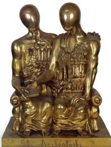
Giorgio de Chirico, Die Archäologen, 1969 Fondazione Giorgio e Isa de Chirico, Rom © VG Bild-Kunst, Bonn 2014 Foto: Foto Schiavinotto