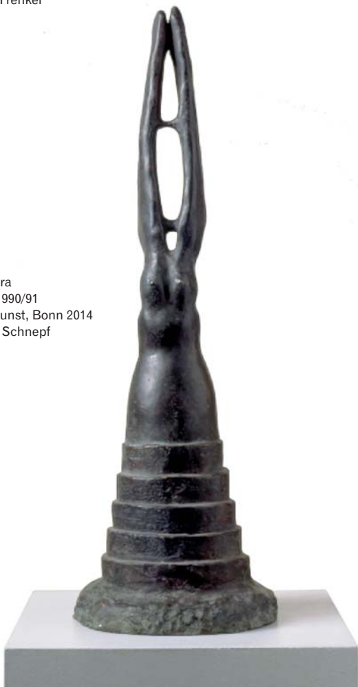
Leiko Ikemura Hase-Frau, 1990/91 © VG Bild-Kunst, Bonn 2014