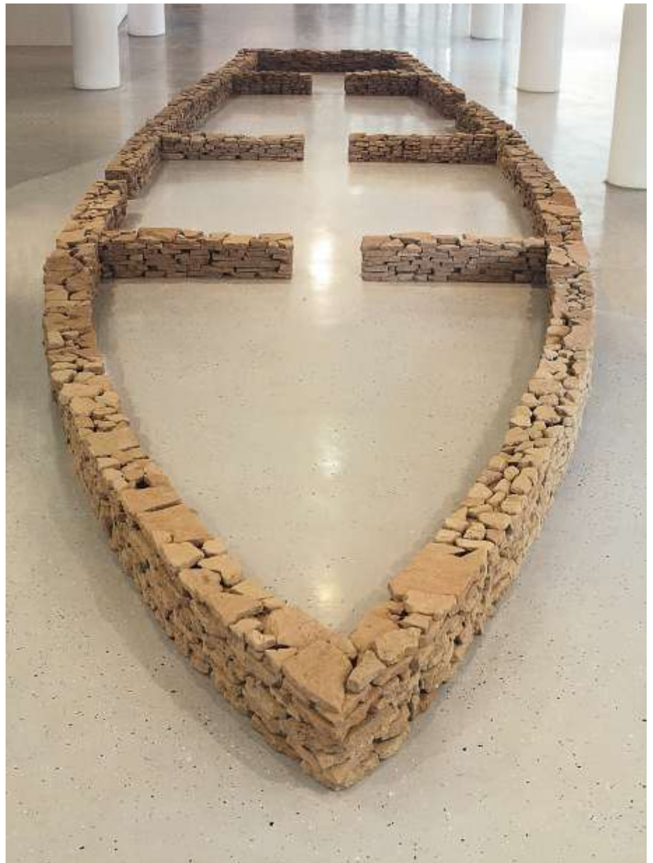
EINMAL NOCH DAS MEER SEHEN ... 2002