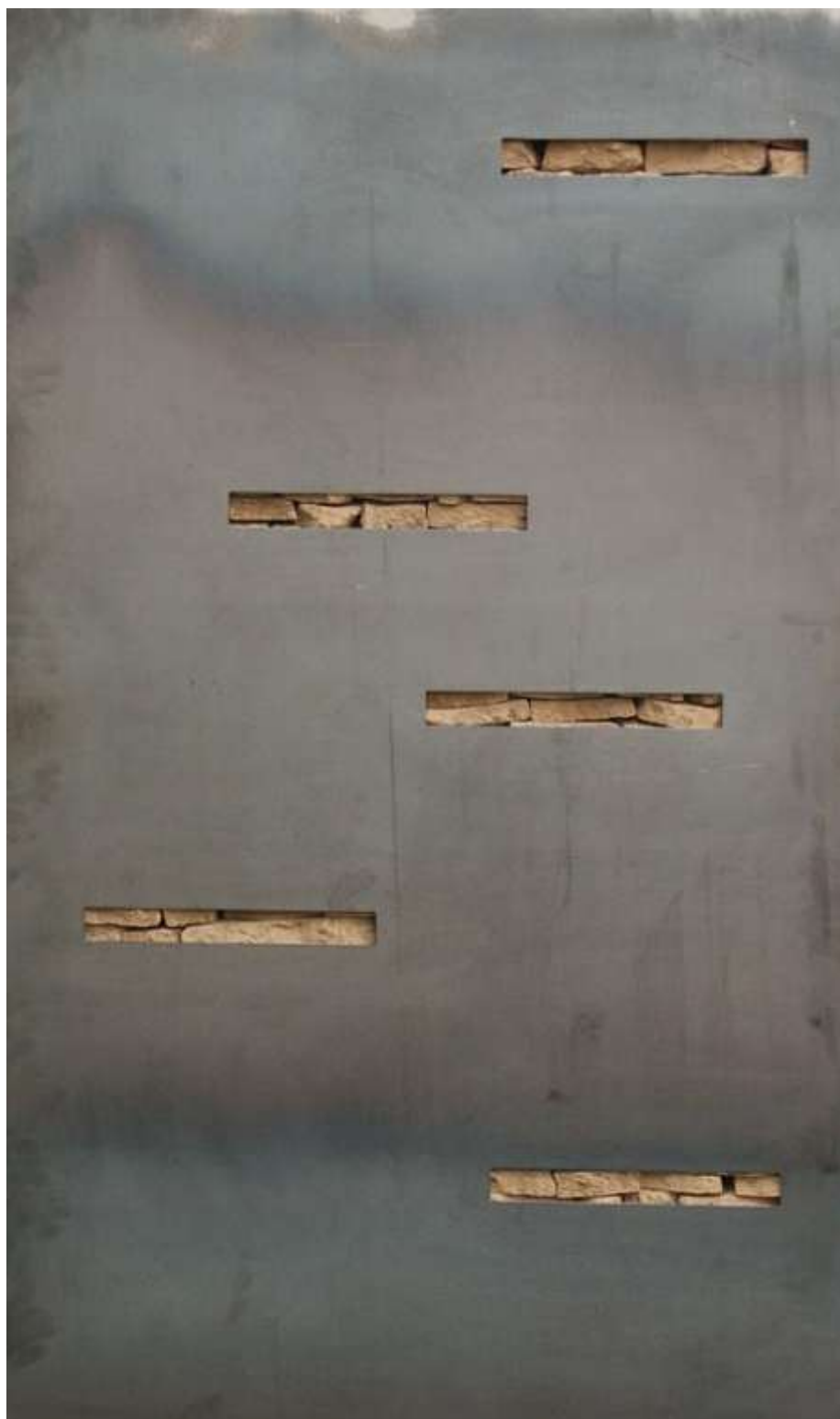
WANDTRESOR 2005 160 x 80 x 10 cm Sammlung Reinking