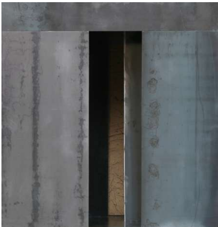
KEIN FENSTER ZUM HIMMEL Nr. 3, 2008 70 x 70 x 70 cm