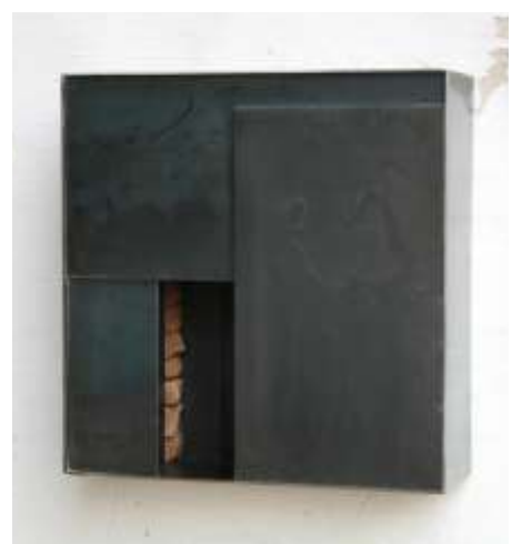
KEIN EINGANG 1, 2008 40 x 37 x 12 cm Privatbesitz