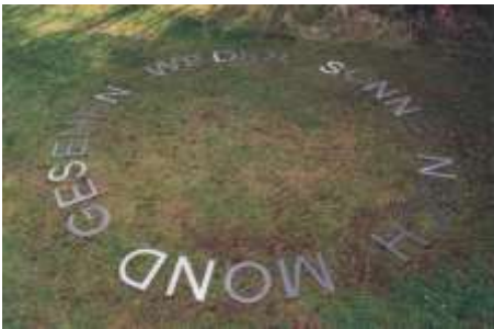
WEDER SONNE NOCH MOND GESEHEN