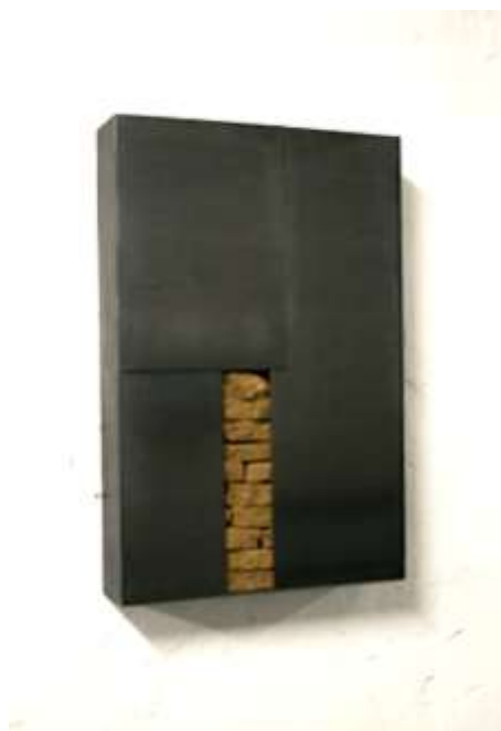
TRESOR 2010 63 x 42 x 10 cm Privatbesitz