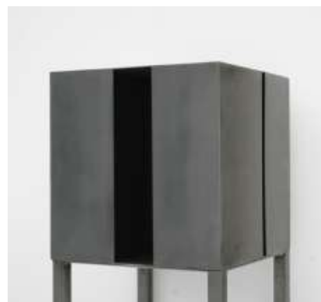
HIER IST NIEMAND Nr. 10, 2009 40 x 40 x 40 cm