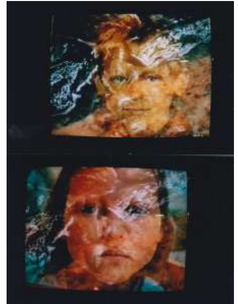
QUELLE 2000 Videoprojektion Kunsthalle Mannheim 2000