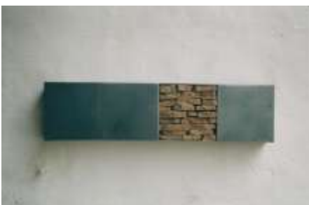
DREI ZU EINS 2001