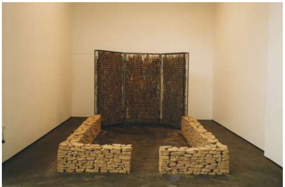
DIE ANDERE SEITE 2001