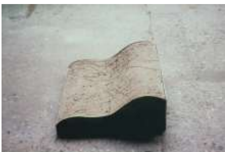
AUSSCHNITT 1998 Stahl, Erde 12 x 40 x 40 cm Privatbesitz