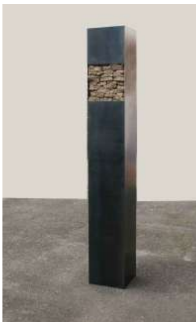
SÄULE Nr. 7, 2007 200 x 30 x 30 cm Privatbesitz