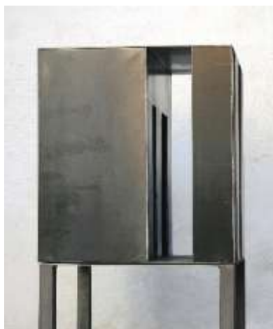
HIER IST NIEMAND Nr. 3, 2008 40 x 40 x 40 cm Privatbesitz