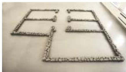
FAMILIENGLÜCK 2000 getrocknete Erdstücke 20 x 600x 800 cm Forum Kunst Rottweil