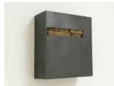
Tresor Nr. 40, 2006 28 x 25,5 x 10 cm Privatbesitz