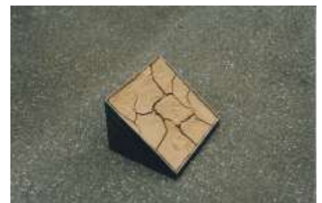
AUSSCHNITT 1998 Stahl, Erde 17 x 17 x 17 cm Privatbesitz