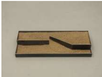
WAS OBEN WAR WIRD UNTEN SEIN Nr. 18, 2005 10 x 30 x 80 cm