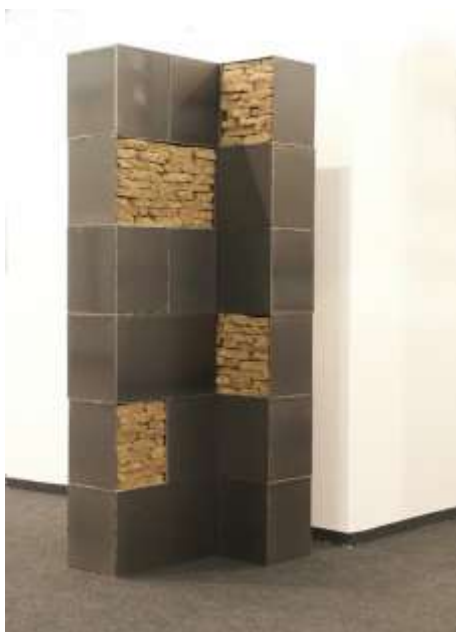
AN JENEM ORT 2004 Stahl, Erde 200 x 80 x 60 cm Privatbesitz