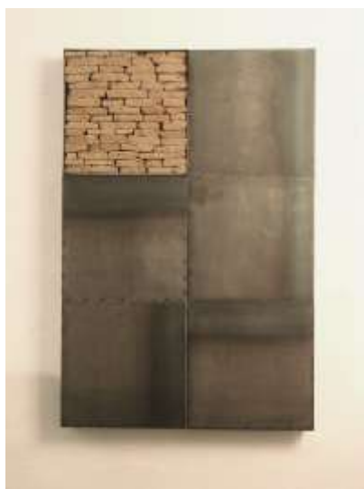
FÜNF ZU EINS Stahl, Erde, 6 - teilig 150 x 10 x 100 cm Privatbesitz