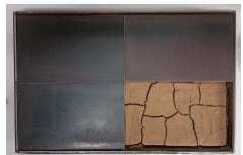
O.T. 2000 Stahl, Erde 3x 40 x 30 cm Privatbesitz