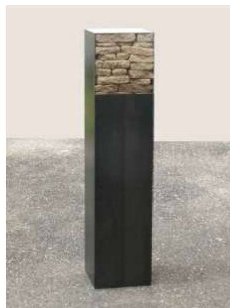
KLEINE STELE 2007 100 x 25 x 25 cm Privatbesitz