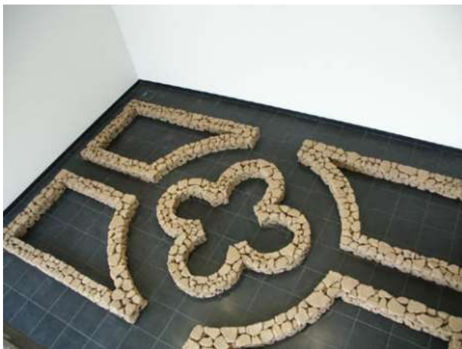
WEDER SONNE NOCH MOND GESEHEN 2003 25 x 700 x 500 cm Kunstsammlung Neubrandenburg