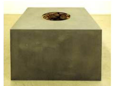
KEIN BRUNNEN 1998 Erde, Stahl 100 x 100 x 63 cm