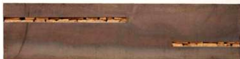
TRESOR Nr. 10, 2005 60 x 200 x 10 cm Hospiz Elias, Ludwigshafen