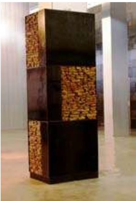
ÜBER ECK 2000 Stahl, Erde 240 x 80 x 80 cm Landratsamt Karlsruhe