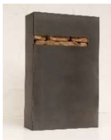
Tresor Nr. 41/2006 45,5 x 29 x 10 cm Privatbesitz