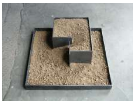
WAS OBEN WAR WIRD UNTEN SEIN Nr. 8, 2004 Stahl, Erde 10 x 35 x 36 cm Sammlung LBB Bank