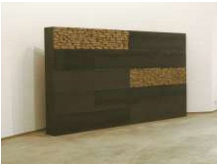
STÜCK UM STÜCK 2003