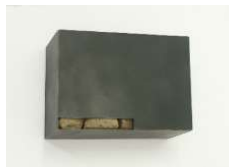
TRESOR Nr. 43, 2006 Größe unbekannt Privatbesitz