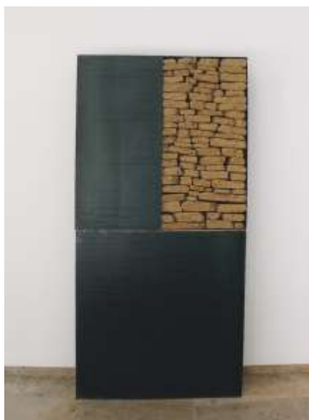
VITRINE 2003 Erde, Stahl 200 x 100 x 25 cm Privatbesitz