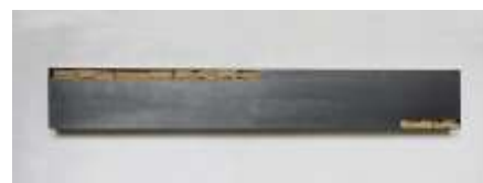
WANSTRESOR 2007 30 x 200 x 10 cm