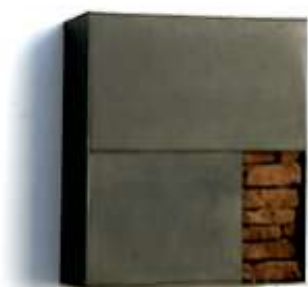
WANDTRESOR Sept. 2009 30 x 27 x 10 cm Privatbesitz