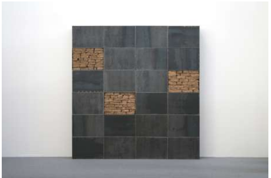
KEINE WAND, 2006 210 x 200 x 25 cm, 24-teilig Galerie Nothelfer