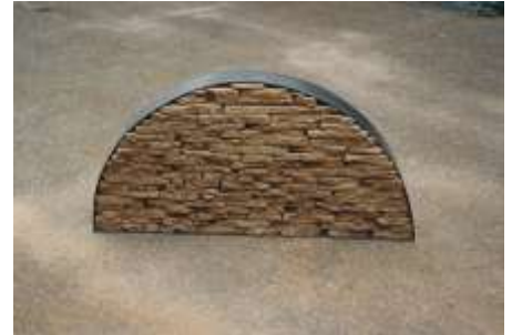
KEIN FENSTER ZUM HIMMEL 2000 Stahl, Erde 40 x 80 x 10 cm