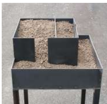
WAS OBEN WAR WIRD UNTEN SEIN Nr. 9, 2004 Stahl, Erde 30 x 40 x 40 cm Sammlung Sontheimer, Mannheim