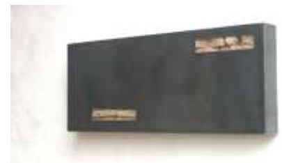
WANDTRESOR 2004 40 x 100 x 10 cm Privatsammlung