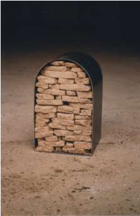
KEIN FENSTER ZUM HIMMEL 2000 Stahl, Erde 50 x 30 x 20 cm Privatbesitz