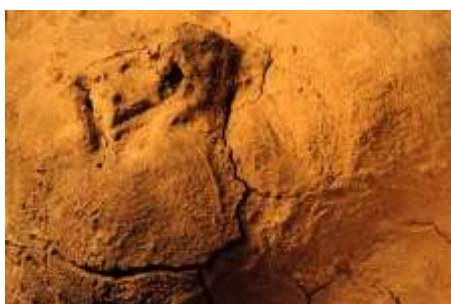
ICH SCHLAFE NUR 2002 je Fotografie auf Aludibond 66 x 100 cm