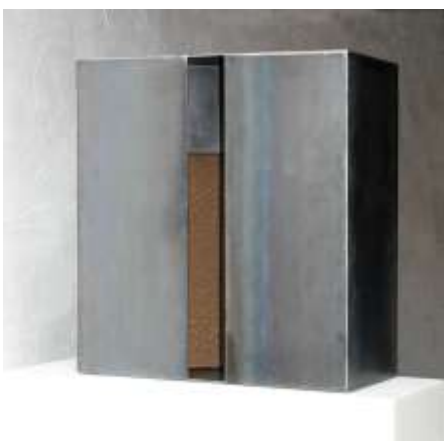
HIER IST NIEMAND Nr. 8, 2008 70 x 70 x 35 cm