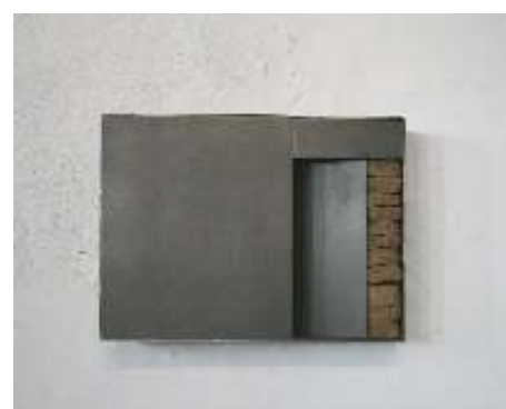
WANDTRESOR halboffen 2009 31 x 44 x 10 cm Privatsammlung