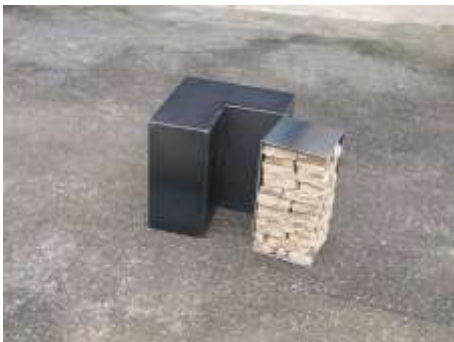
O. T. 2006 40 x 40 x 40 cm 2-teilig