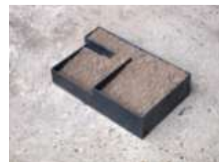
Nr. 24, 2006 12 x 50 x 50 cm