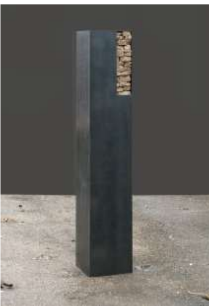
SÄULE Nr. 9, 2007 200 x 30 x 30 Hospiz Elias , Ludwigshafen