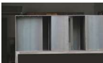
HIER IST NIEMAND Nr. 9, 2008 40 x 180 x 40 cm