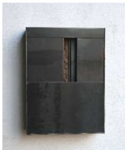
OFFEN—ZU Nr. 3, 2008 43 x 32 x 10 cm Galerie C. Grimaldis, Baltimore