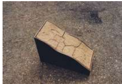
AUSSCHNITT 1998 Stahl, Erde 20 x 28 x 13 cm Privatbesitz