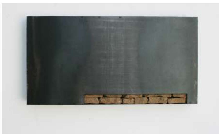
WANDTRESOR 2009 50 x 100 x 10 cm Privatbesitz