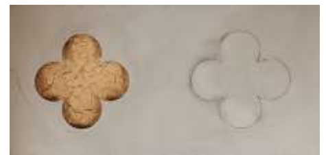
KEIN ROSENHAIN 2000 Erde, Stahlblech, Holz 33 x 65 x 5 cm