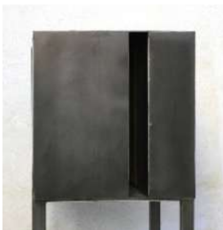
HIER IST NIEMAND Nr. 2, 2008 40 x 40 x 40cm Privatbesitz