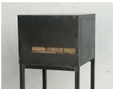
TRESOR Nr. 19, 2005/2006 30 x 40 x 40 cm Privatsammlung