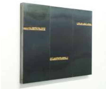
TRESOR Nr. 16, 2005 145 x 180 x 10 cm Sammlung Landesmuseum Mainz