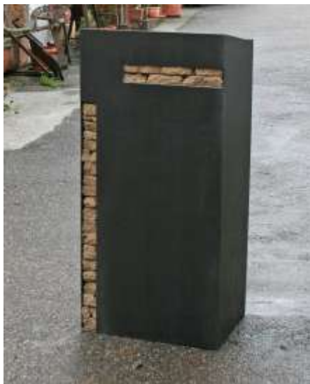
SÄULE Nr. 9, 2007 200 x 25 x 25 cm Privatbesitz Detail