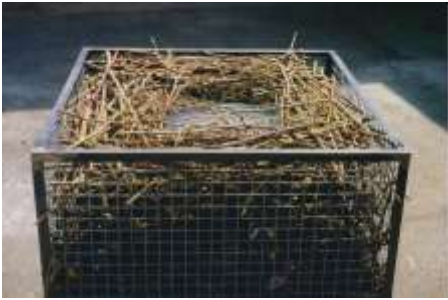
DREH DICH UM, DREH DICH UM .... 2000 Gitterbox, Dornengebüsch, Video VHS Niederrheinischer Kunstverein Wesel