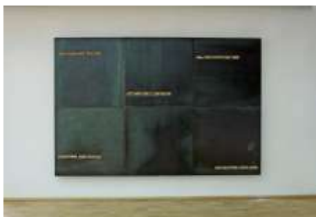
WANDTRESOR 2004/2005 160 x 240 x 10 cm, 6-teilig