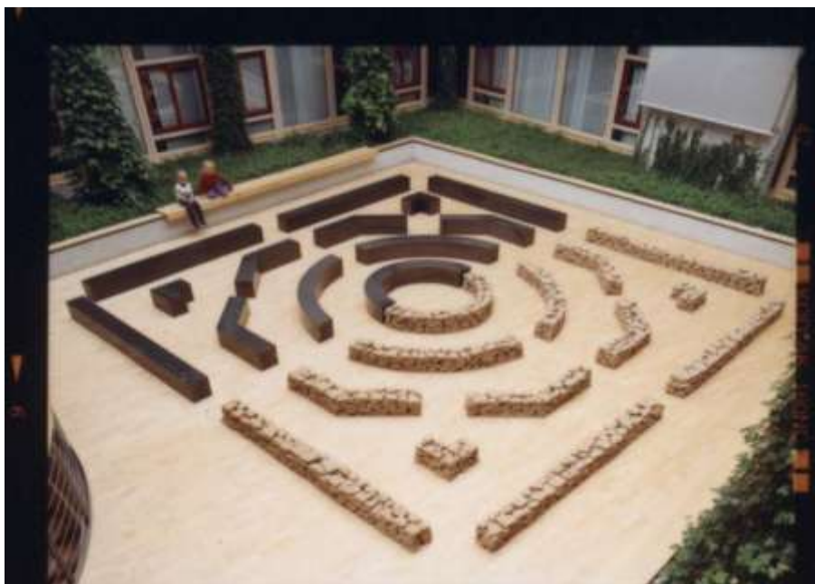
EINEN TEMPEL BAU ICH NICHT 2002 30 x 800 x 800 cm Dominohaus, Atrium, Reutlingen