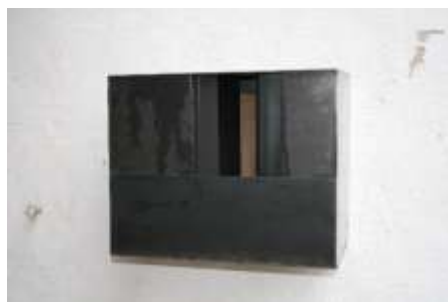
KANN SEIN, 2008 36 x 25 x 25 cm Galerie Georg Nothelfer