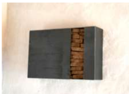
TRESOR 2008 26 x 39 x 10 cm Privatbesitz