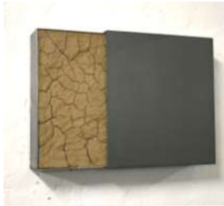
WANDSCHUBER 1998 40 x 50 cm (variabel), 2 - teilig Privatbesitz