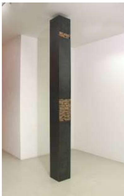
Raumregal 2006 275 x 25 x 25 cm Privatbesitz