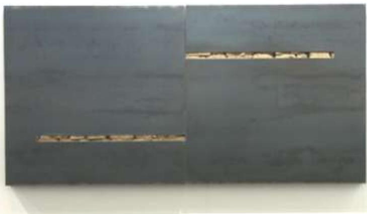
DIPTYCHON Nr. 17, 2005 100 x 200 x 10 cm, 2-teilig Zentrum Verkündigung, Darmstadt