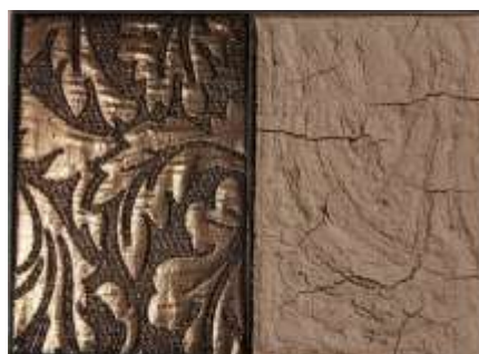
O.T. 2000 Stahl, Erde, Textil 27 x 20 x 3 cm