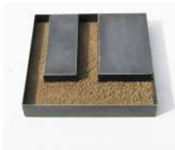
Nr. 25, 2006 10 x 50 x 50 cm