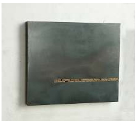
TRESOR Nr. 25, 2005 90 x 105 x 10 cm