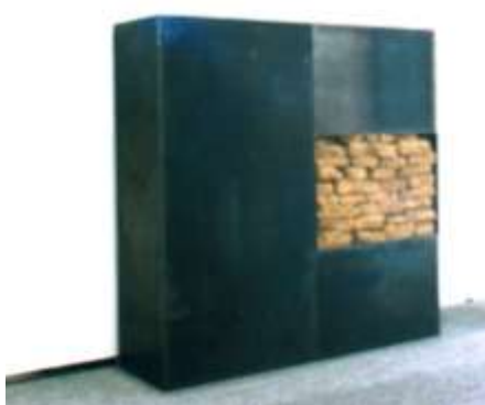
FÜNF ZU EINS 2001 Stahl, Erde, 6-teilig 120 x 100 x 20 cm Privatbesitz