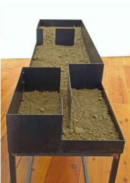
WAS OBEN WAR WIRD UNTEN SEIN