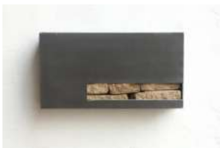
TRESOR Nr. 4, 2005 21 x 39 x 10 cm Privatbesitz