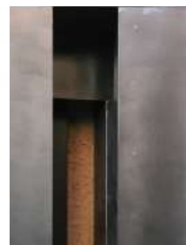
DETAIL TRESOR Nr. 8