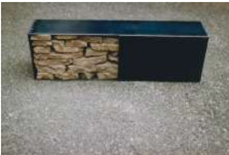
DIPTYCHON 1998 Erde, Stahl 20 x 60 x 10 cm