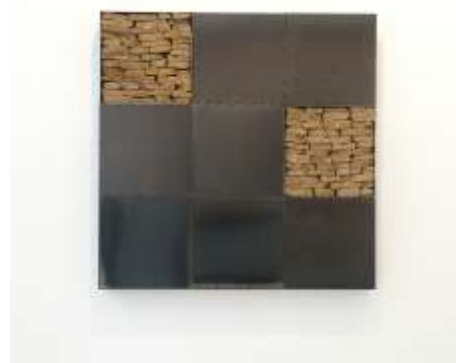
SIEBEN ZU ZWEI 2004 9 - teilig 120 x 120 x 10 cm Sammlung Ritter Sport