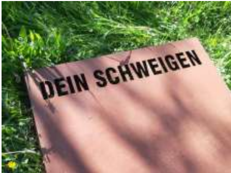
DEIN SCHWEIGEN 2007 Stahl, Schrift gelasert je 10 x 70 x 200 cm, 2 - teilig Galerie Vayhinger, Singen Dom Ratzeburg Friedhof Augsburg