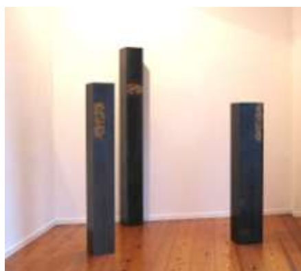
3 SÄULEN unterschiedliche Größen Galerie Georg Nothelfer 2007