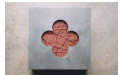
KEIN ROSENHAIN 2000 Rote Erde, Stahl 30 x 30 x 10 cm