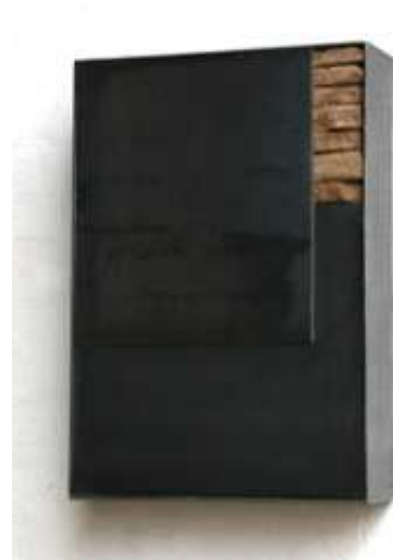
TRESOR Nr. 1, 2008 47 x 31 x 10 cm Privatbesitz