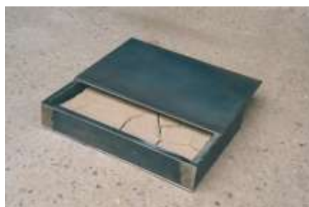
KLEINER SCHATZKASTEN 1998 Stahl, Erde 5 x 30 x 21 cm, Multiple 12 Unikate Privatbesitz