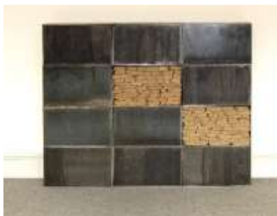
ZWEI ZU ZEHN, 2005 160 x 150 x 20 cm 12-teilig Sammlung Reinking