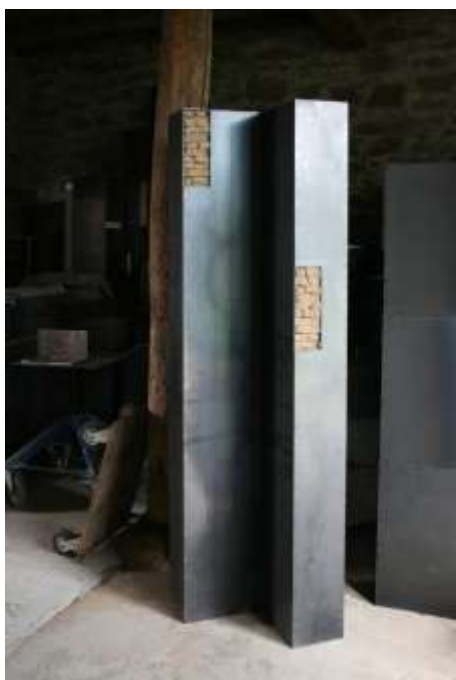
ÜBER ECK 2007 200 x 70 x 70 cm Privatbesitz