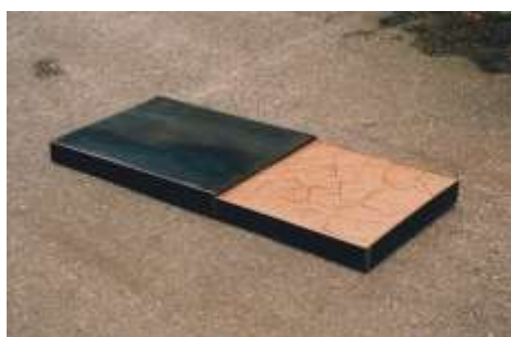
SCHUBER 2002 Stahl, rote Erde 8 x 50 x 70-140 cm, variabel Sammlung Reinking