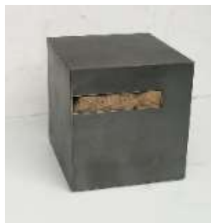
TRESOR Nr. 38, 2006 25 x 24,5 x 26 cm Privatbesitz