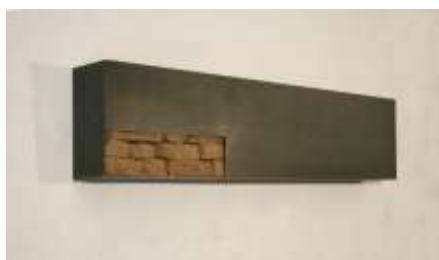
WANDKONSOLE 2007 30 x 100 x 10 cm Privatbesitz