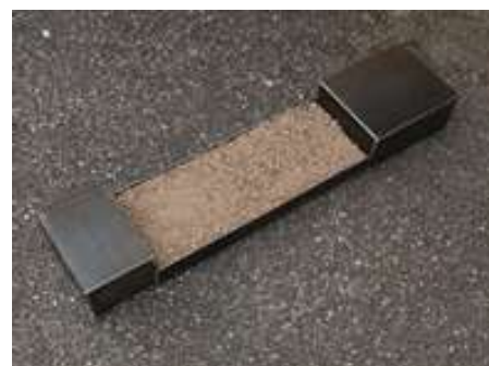
WAS OBEN WAR WIRD UNTEN SEIN Nr. 20, 2005 10 x 90 x 20 cm