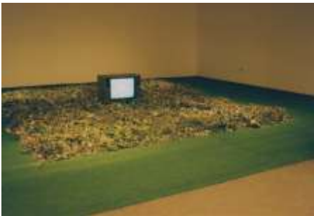
DREH DICH UM, DREH DICH UM .... 2000 Dornengebüsch, Video VHS Niederrheinischer Kunstverein Wesel