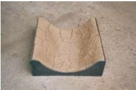
AUSSCHNITT 1998 Stahl, Erde 10 x 40 x 40 cm Privatbesitz