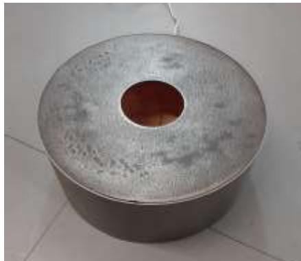
O.T. 1998 Erde, Stahl, Licht 20 x Ø 45 cm Privatbesitz