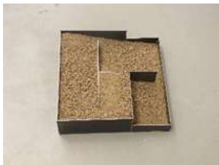
WAS OBEN WAR WIRD UNTEN SEIN Nr. 16, 2005 10 x 40 x 40 cm