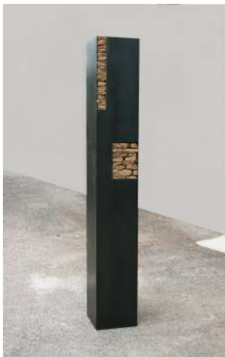
SÄULE Nr. 14, 2010 25 x 200 x 25 cm Privatbesitz