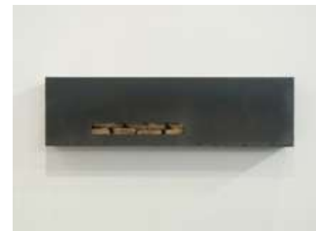
TRESOR Nr. 14, 2005 20 x 70 x 10 cm Privatbesitz