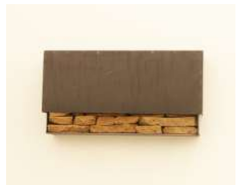
WANDSCHUBER 2004 Stahl, Erde, 2 - teilig 40 x 60 x 11 cm Privatbesitz