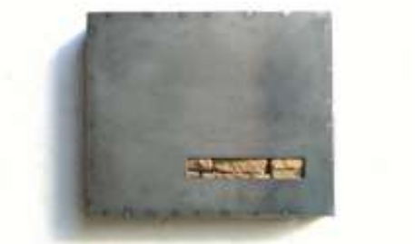
TRESOR Nr. 1, 2005 30 x 40 x 10 cm Privatbesitz