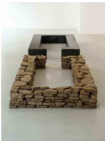
KEIN SCHRITT ZURÜCK..2003 Stahl, Erde 20 x 450 x 120 cm Galerie Harthan, Stuttgart