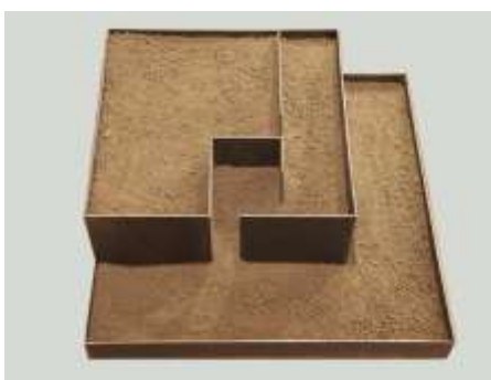
WAS OBEN WAR WIRD UNTEN SEIN Nr. 4, 2004 20 x 50 x 50 cm Privatbesitz