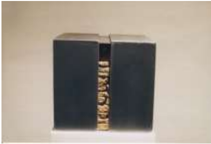
SCHATZKASTEN 1999 Erde, Stahl, 3-teilig 40 x 40 x 40 cm, variabel Privatbesitz