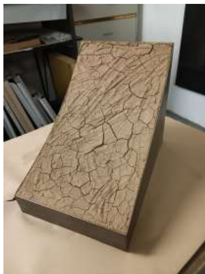
AUSSCHNITT 2000 Erde Stahlblech 45 x 33 x 30 cm