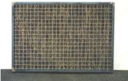
KEIN SCHRITT ZURÜCK 2000 100 x 155 x 12 cm Stahl, Wellengitter, Dornenzweige Sammlung Sontheimer