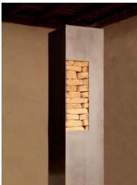
SÄULE Nr. 1, 2007 200 x 30 x 30 cm Privatbesitz