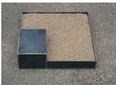
WAS OBEN WAR WIRD UNTEN SEIN Nr. 21, 2005 10 x 40 x 40 cm Sammlung Reinking