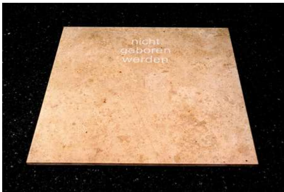
NICHT GEBOREN WERDEN 2003 Juramarmor, Schrift sandgestrahlt 2 x 80 x 80 cm Privatbesitz