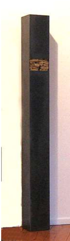
SÄULE Nr. 3, 2007 250 x 25 x 25 cm Privatbesitz