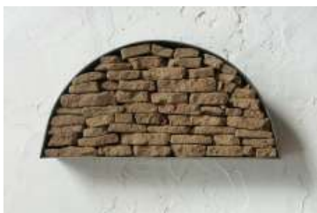
KEIN FENSTER ZUM HIMMEL 2003 Stahl, Erde 20 x 40 x 10 cm Privatbesitz