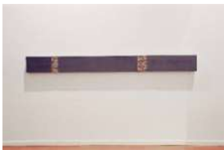
WANDTRESOR 2007 40 x 300 x 10 cm Privatbesitz