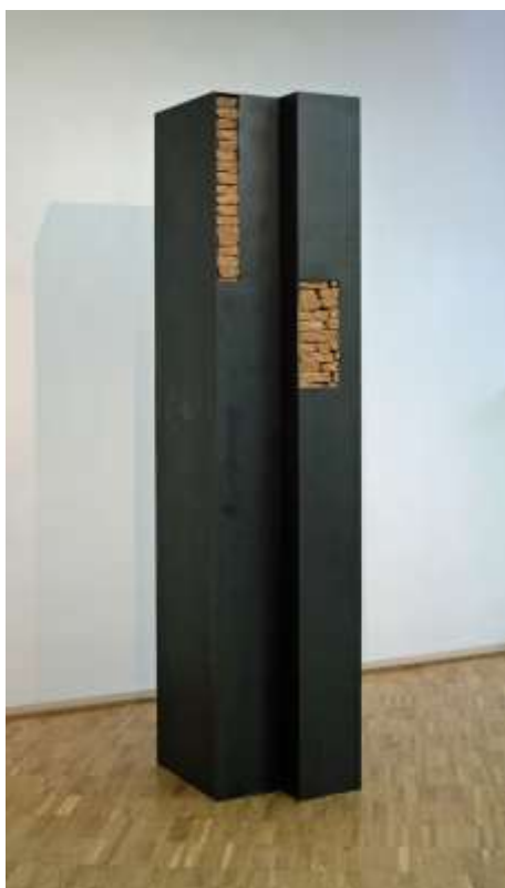
ÜBER ECK, 2010 200 x 50 x 50 cm Sammlung Pfalzgalerie Kaiserlautern