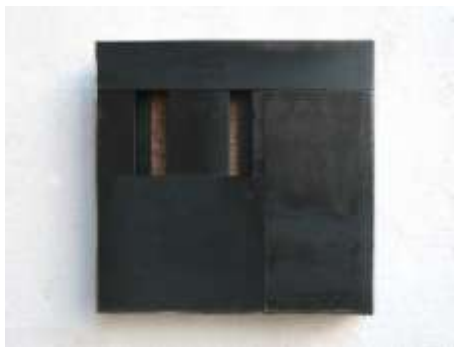
OFFEN—ZU Nr. 2, 2008 41 x 41 x 10 Galerie C. Grimaldis, Baltimore