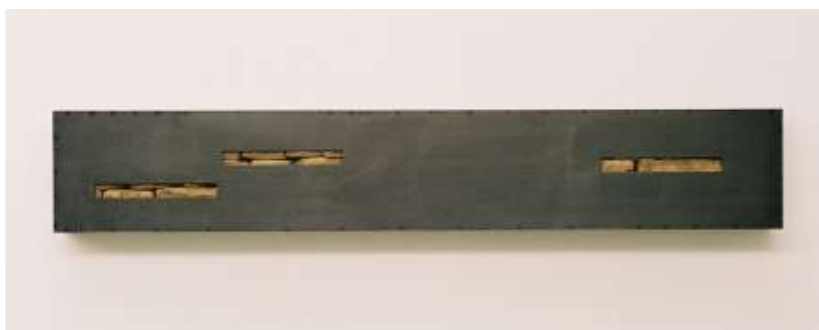
TRESOR Nr. 5, 2005 30 x 180 x 10 cm