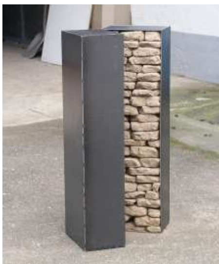
EINS ZU EINS 2003 Stahl, Erde, 2 Teile je 100 x 20 x 20 cm