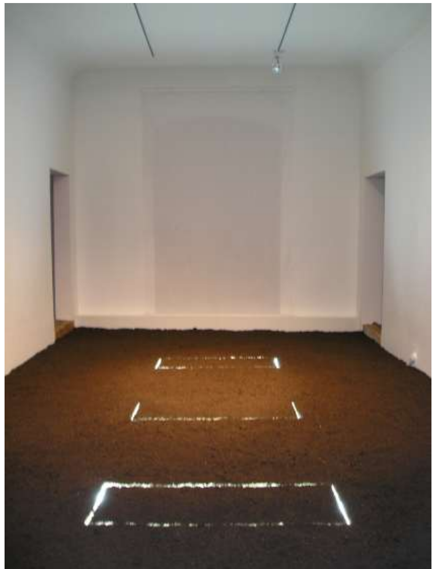
O.T. 2006 Raumgröße Erde, Leuchtmittel KULTUM Museum der Minoriten, Graz