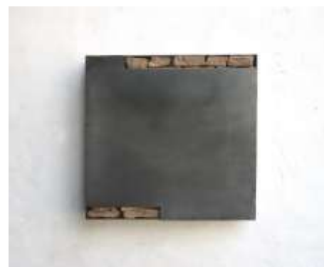
TRESOR 2009 49 x 48 x 10 cm Privatbesitz