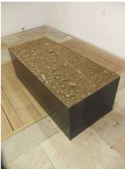
ZEIT ZU GEHEN 2007 Stahl, Erde, Leuchtmittel 50 x 70 x 200 cm