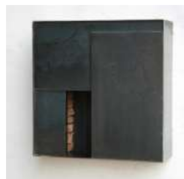
KEIN EINGANG Nr. 1, 2008 40,5 x 37 x 12 cm Privatbesitz