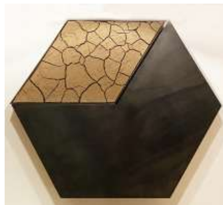
O.T. 2004 Stahl, Erde, 2 - teilig 80 x 80 x 10 cm Privatbesitz