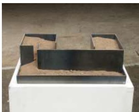
WAS OBEN WAR WIRD UNTEN SEIN Nr. 3, 2003 Stahl, Erde 10 x 38 x 28 cm Privatbesitz