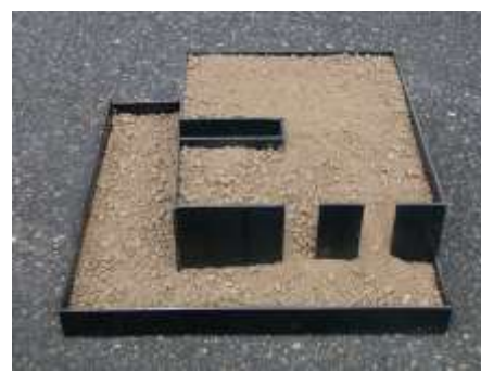
WAS OBEN WAR WIRD UNTEN SEIN Nr. 7, 2004 10 x 35 x 35 cm Stahl, Erde Privatbesitz