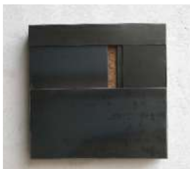
KEIN FENSTER ZUM HIMMEL Nr. 1, 2007 50 x 50 x 10 cm Galerie C. Grimaldis, Baltimore