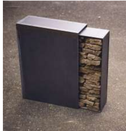
Schuber 2001 Stahl, Erde 40 x 30 x 10 cm, variabel