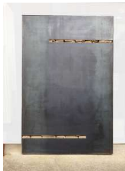
TRESOR Nr. 30, 2005 160 x 100 x 10 cm