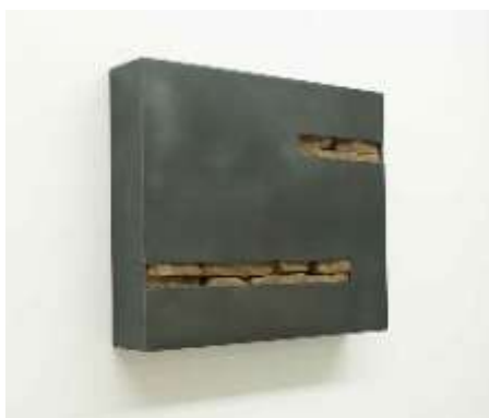
TRESOR Nr. 36, 2006 42 x 51 x 10 cm