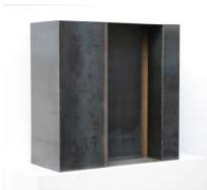
HIER IST NIEMAND Nr. 7, 2008 70 x 70 x 35 cm