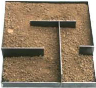
WAS OBEN WAR WIRD UNTEN SEIN Nr. 13 , 2004 Stahl, Erde 10 x 28 x 38 cm