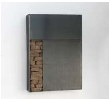
WANDTRESOR Nr. 2009 58 x 40 x 10 cm Privatbesitz