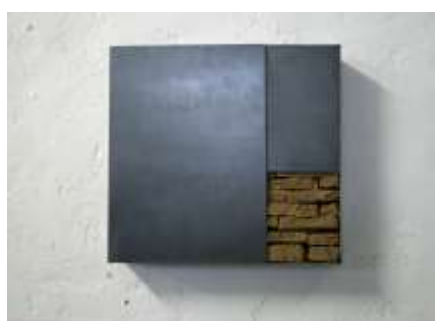
TRESOR 2010 38 x 40 x 10 cm Privatbesitz