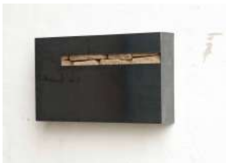
TRESOR Nr. 26, 2005 25 x 40 x 10 cm Privatsammlung