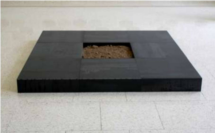
9 FELDER OHNE NAMEN 1998