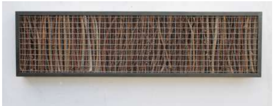
O.T. 2000 Stahl, Wellengitter, Dornenzweige 40 x 152 x 12 cm