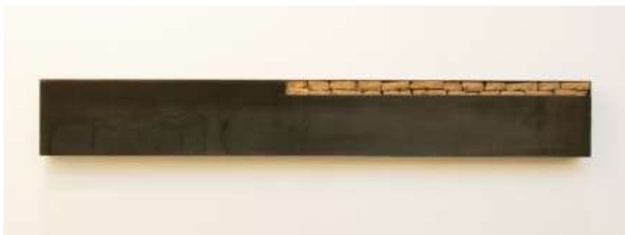
WANDTRESOR 2007 35 x 200 x 10 cm