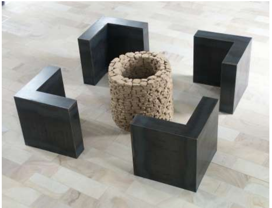
BRUNNENKREUZ - KREUZBRUNNEN 2006 100 x 280 x 280 cm Kunsthalle Kloster Gravenhorst, Hörstel