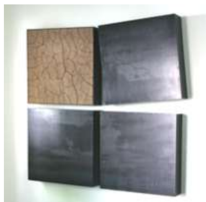
KREUZ 2008 120 x 120 x 10 cm vierteilig Evang. Studierenden Gemeinde Darmstadt