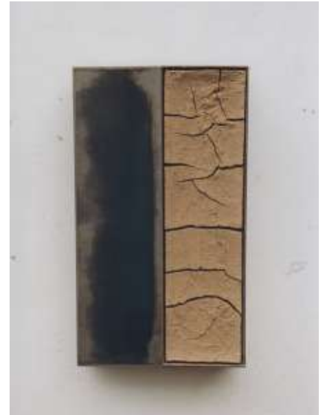
GEGENÜBER 1998 Erde, Stahl unbekannte Grösse Privatbesitz