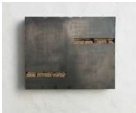
TRESOR Nr. 23, 2006 50 x 62 x 10 cm Privatbesitz