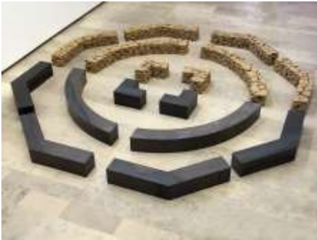
KEIN WESEN KANN ZU NICHTS ZERFALLEN