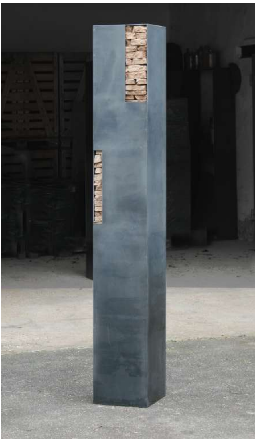
SÄULE Nr. 5, 2007 200 x 30 x 30 cm Privatbesitz