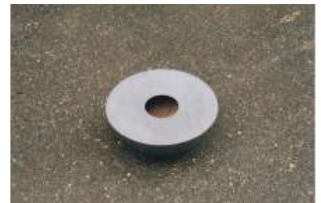
O.T. Stahl, Erde 20 x Ø40 cm