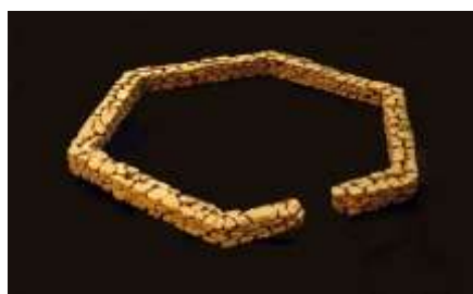
WABE 2001/2002 Erdstücke ca. 20 x 280 x 280 cm Sammlung Reinking