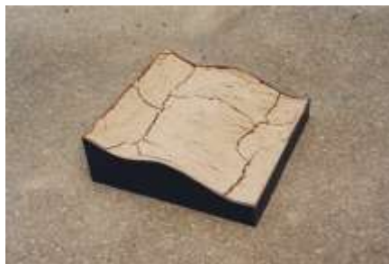
AUSSCHNITT 1998 Stahl, Erde 10 x 40 x 40 cm