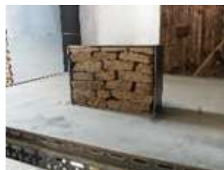
KLEINER KASTEN 2004 20,5 x 30, 5 x 10cm Privatbesitz