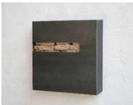
KLEINER KASTEN Nr. 13, 2007 Größe unbekannt Privatbesitz