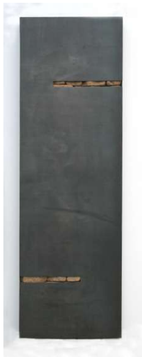
TRESOR Nr. 29 200 x 60 x 10 cm Galerie Costas Grimaldis, Baltimore