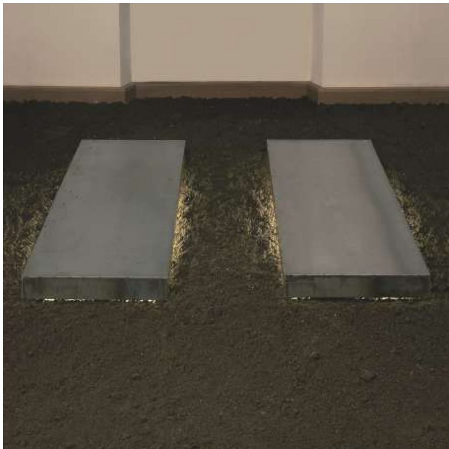
GANZ IN DEINER NÄHE 2003 Stahl, Erde, Leuchtmittel 12 x 400 x 400 cm