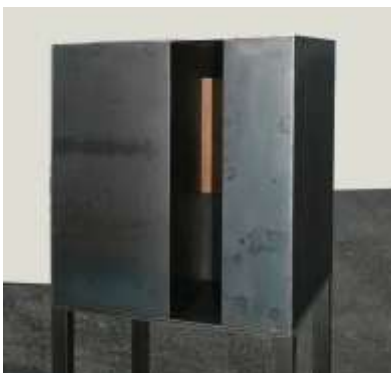
HIER IST NIEMAND Nr. 4, 2008 40 x 40 x 40