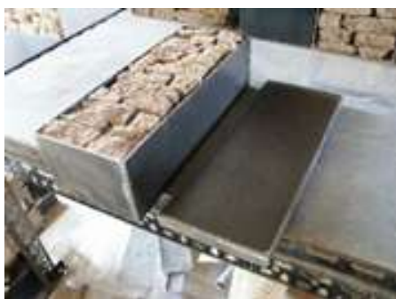
OFFEN—ZU , 2004 2 - teilig 37 x 30 x 10 cm Privatbesitz