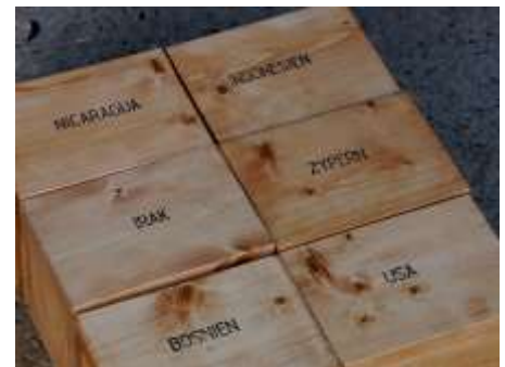
Holzbehältnisse für die Friedhofserden im Museumsgarten side by side

Im Jahr 2003 habe ich mit meinem Projekt side by side begonnen. Ein Projekt, in dem ich den Versuch unternommen habe, in jedem Land dieser Welt einen Friedhof oder eine heilige Stätte zu finden, aus dem mir eine handvoll Erde überlassen wird. In side by side geht es mir um Erinnerung und Gedanken an geliebte verstorbene Menschen, aber auch um ein Gefühl von Endlichkeit, verbunden mit dem Schicksal aller Menschen jedweder Nationalität und Glaubens. Welche Unterschiede in den Ländern unserer Welt gibt es wenn Menschen bestattet /verbrannt werden? Wie unterscheiden sich die Religionen im Umgang mit dem Sterben dem Tod, und mit dem was bleibt , dem Leben „Danach“ ?