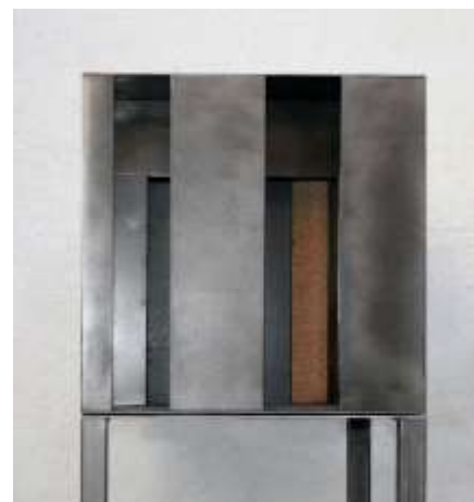
HIER IST NIEMAND Nr. 3, 2008 40 x 40 x 40 cm Ansicht frontal