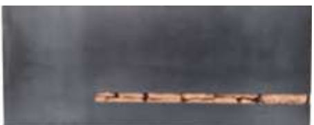
TRESOR Nr. 30, 2005, Abschnitt 40 x 100 cm