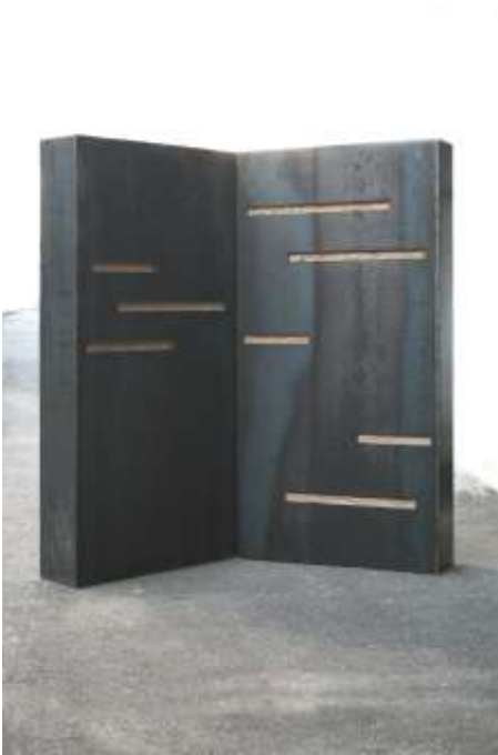
O.T. 2007/2008 200 x 200 x 80 cm Sammlung Diözese, Trier