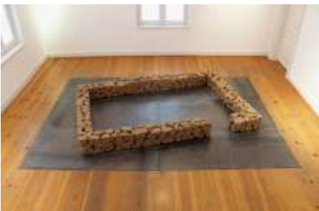
EINGANG AUSGANG OST 2003