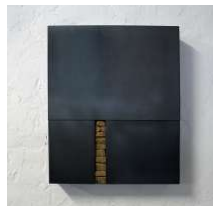
OFFEN—ZU 2008 50 x 35 x 10 cm