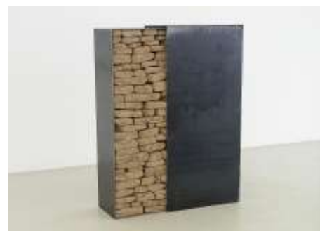
SCHUBER 2003 Stahl, Erde, 2 - teilig 100 x 100 (variabel) x 30 cm, Privatbesitz