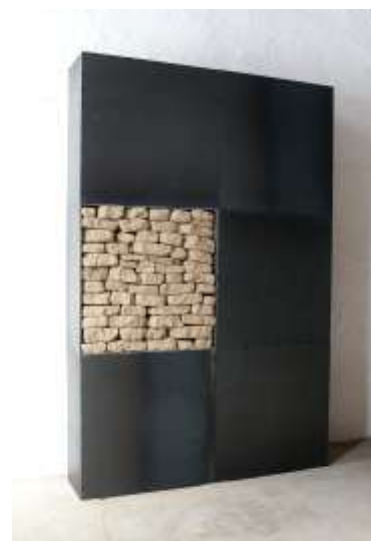
FÜNF ZU EINS Stahl, Erde, 6 - teilig 180 x 120 x 20 cm