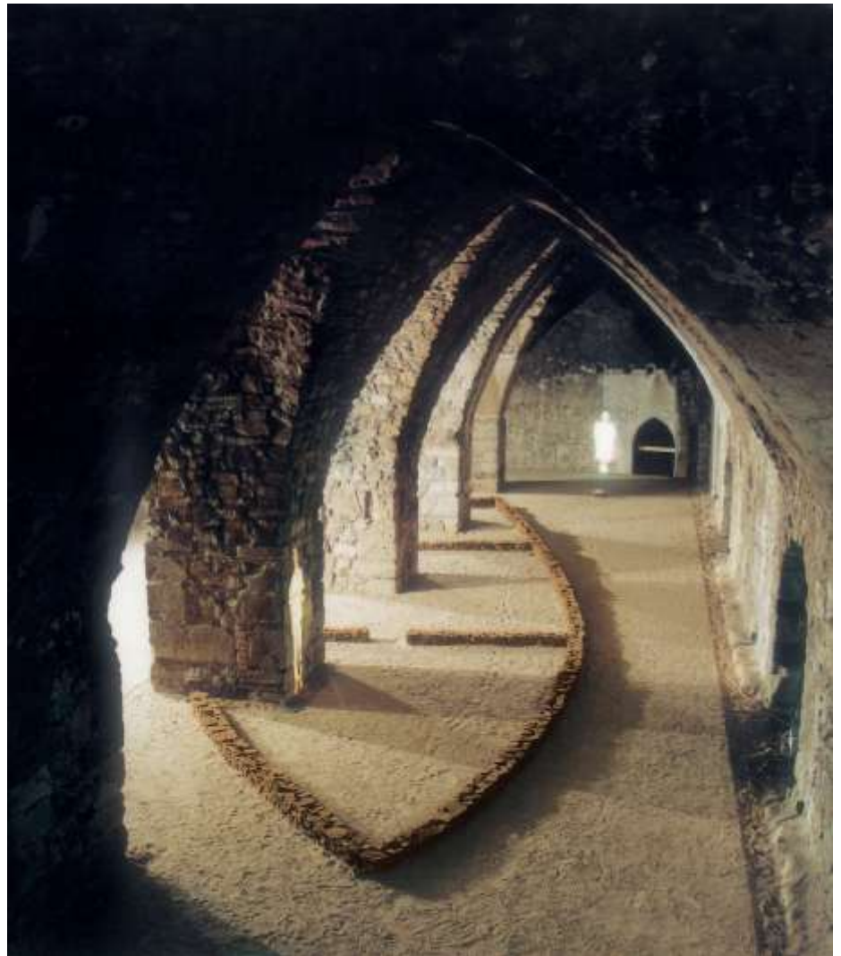
EINMAL NOCH DAS MEER SEHEN 2002