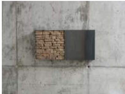
EINS ZU EINS 2000 Stahl, Erde 40 x 80 x 10 cm Landratsamt Karlsruhe