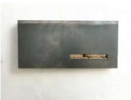
Tresor Nr. 22 38 x 78 x 10 cm Privatbesitz