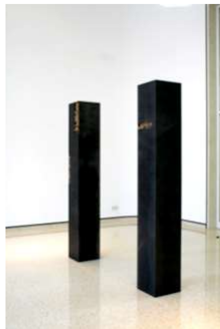
2 Säulen je 200 x 30 x 30 cm Galerie Harthan, Stuttgart Privatsammlung