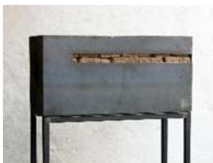
TRESOR Nr. 32, 2007 34,5 x 30,5 x 70 cm Sockel 100 cm Darmstadt, Evang. Kirchenverwaltung