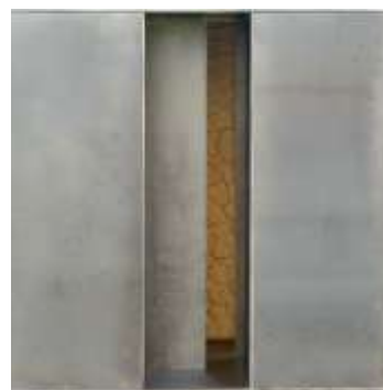
HIER IST NIEMAND Nr. 11, 2009 40 x 40 x 40 cm