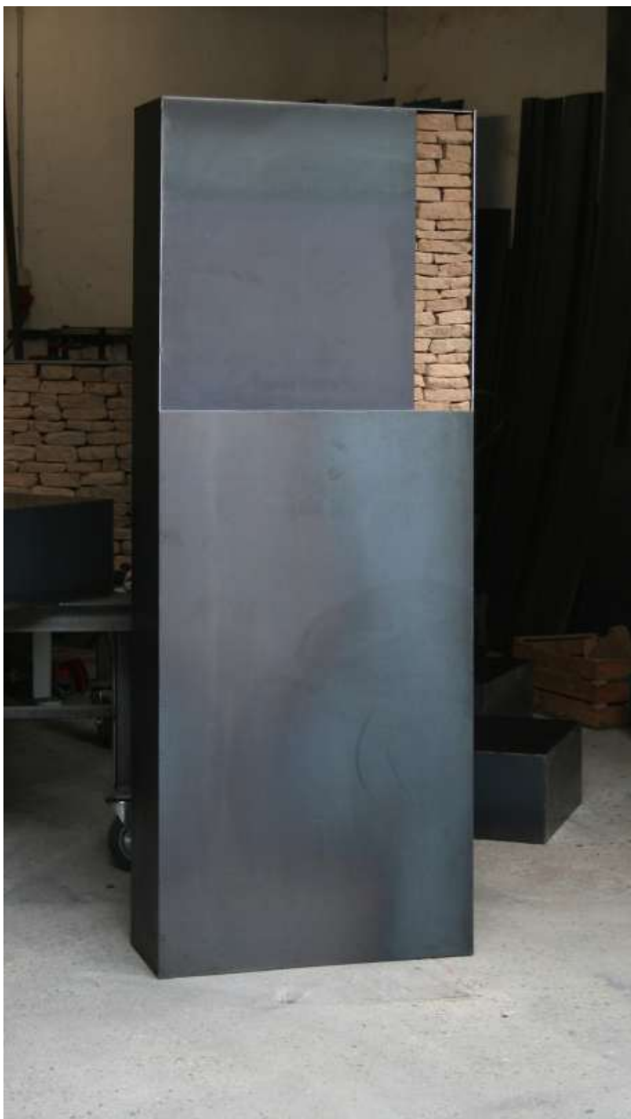
TRESOR 2010 200 x 80 x 30 cm