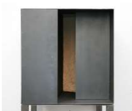
HIER IST NIEMAND Nr. 5, 2008 40 x 40 x 40cm