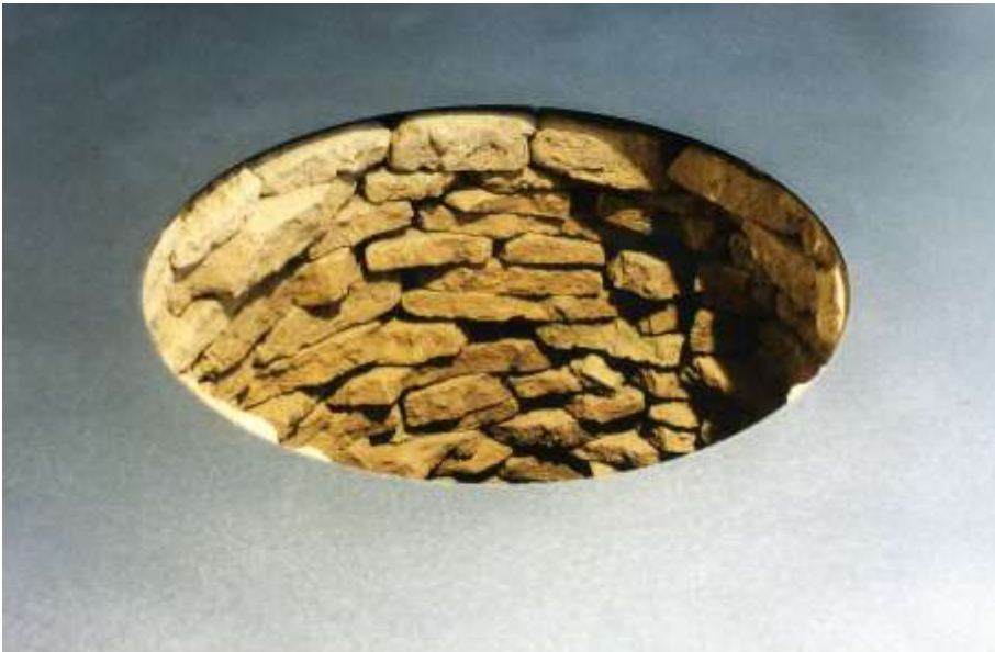
KEIN BRUNNEN 1998 Erde, Stahl 100 x 100 x 63 cm Detail