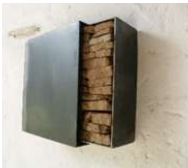
WANDSCHUBER 2004 30 x 40 (variabel) x 10 cm 2 - teilig Privatbesitz