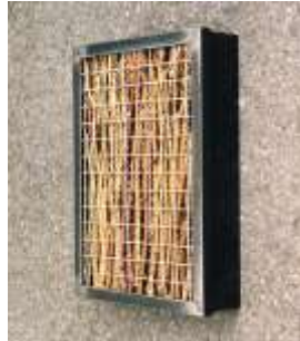
O.T. 2000 Stahl, Wellengitter, Dornenzweige 50 x 40 x 10 cm Privatbesitz