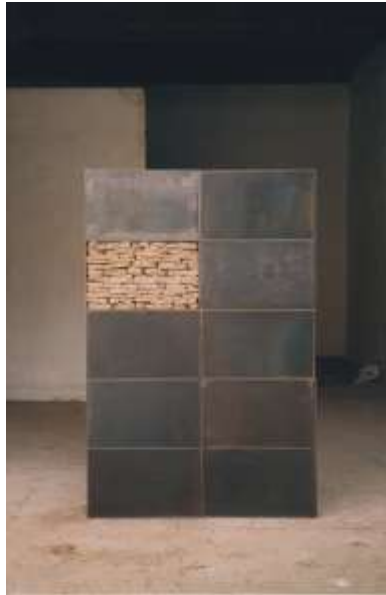
NEUN ZU EINS 2001