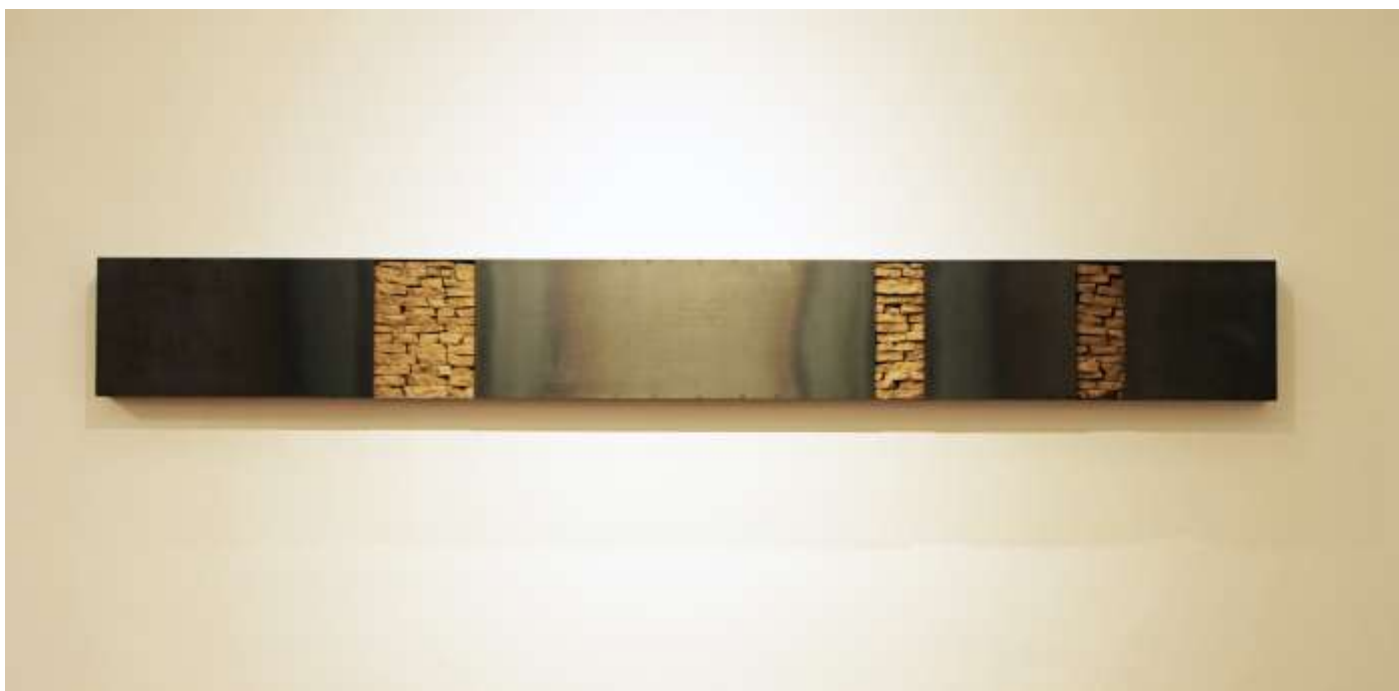
WANDKONSOLE 2009 40 x 300 x 10 cm Sammlung Museum Ulm