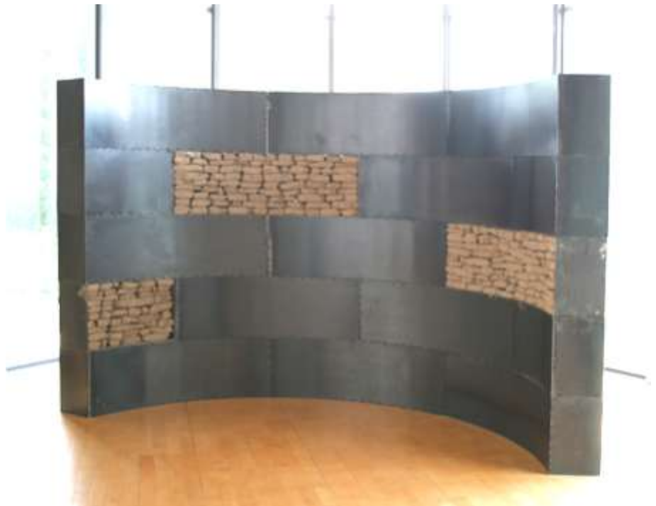
KANN SEIN .... 2004 Stahl, Erde 200 x 360 x 180 cm Galerie Sebastian Fath, Mannheim Kulturspeicher Museum Würzburg 2005 Galerie Nothelfer, Berlin Villa Streccius, Landau Sepulkralmuseum Kassel 2007