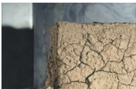
O.T. 2003 Fotografie auf Aludibond 160 x 100 cm