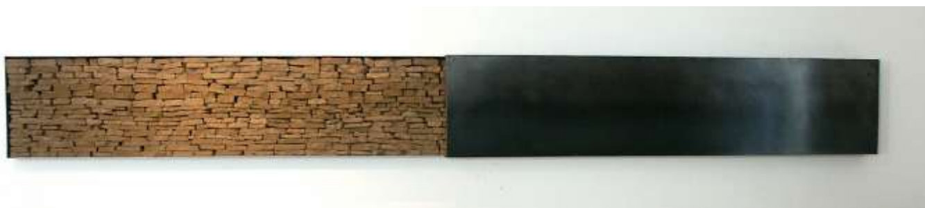
SCHUBER 2003 40 x 400 (variabel) x 12cm, 2 - teilig Neues Museum Weserburg, Bremen Sammlung Reinking