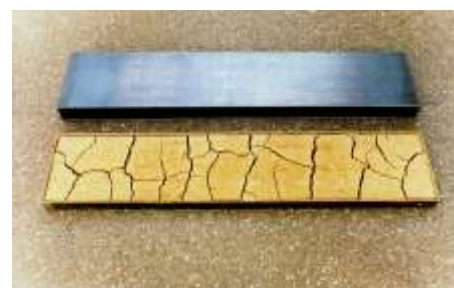
BODENSCHUBER 2003 Stahl, gerissene ausgetrocknete Erde 5 x 100 x 20 cm, 2-teilig Privatbesitz