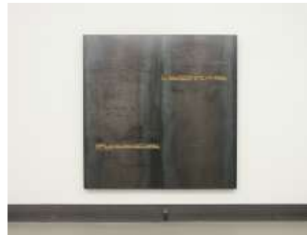
TRESOR Nr. 8, Diptychon, 2005 200 x 200 x 10 cm, 2-teilig Privatbesitz